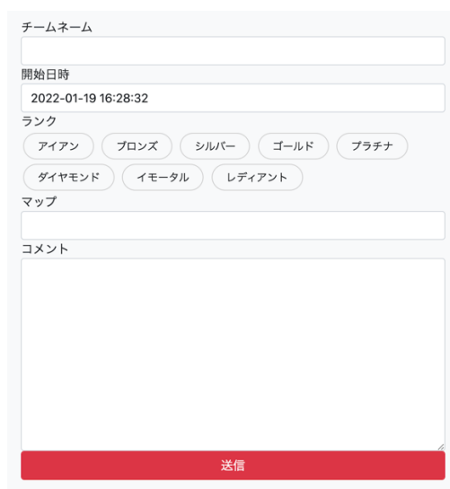
図2：入力フォームの様子